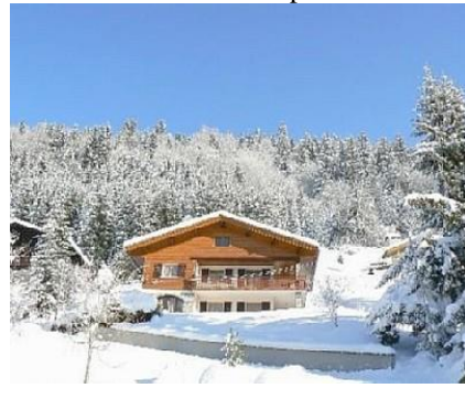
Le chalet Fleurs des Alpes en hiver