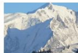
Le Mont Blanc 4807 m