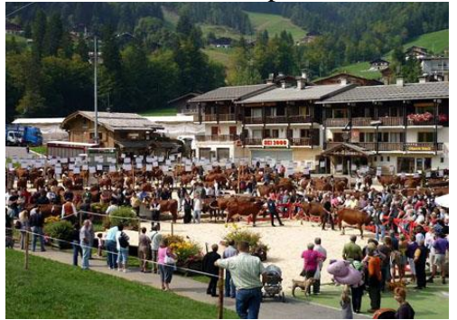
Foire de la Croix en septembre