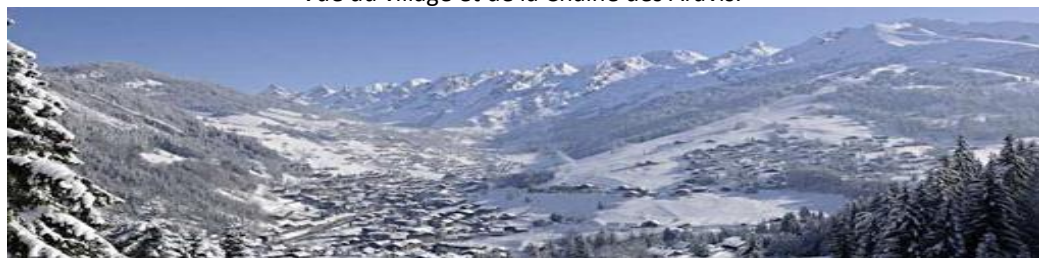
Vue du village et de la Chaîne des Aravis.