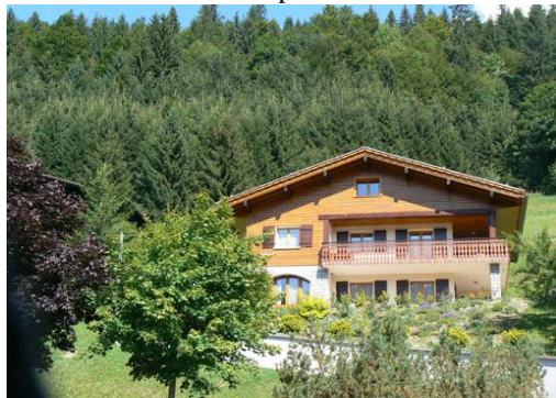
Le chalet Fleurs des Alpes en été