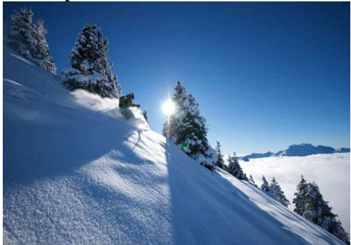
Ski en poudreuse