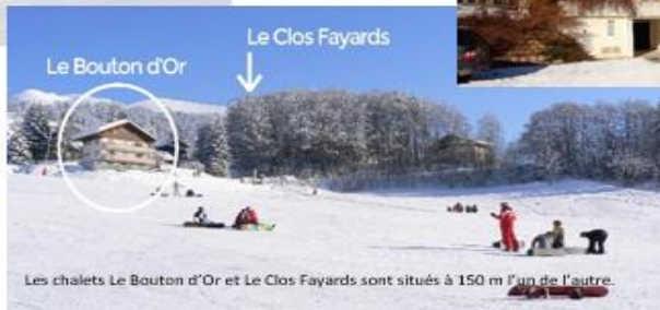
Les chalets Le Bouton d'Or et Le Clos Fayards sont situés à 150 m l'un de l'autre.