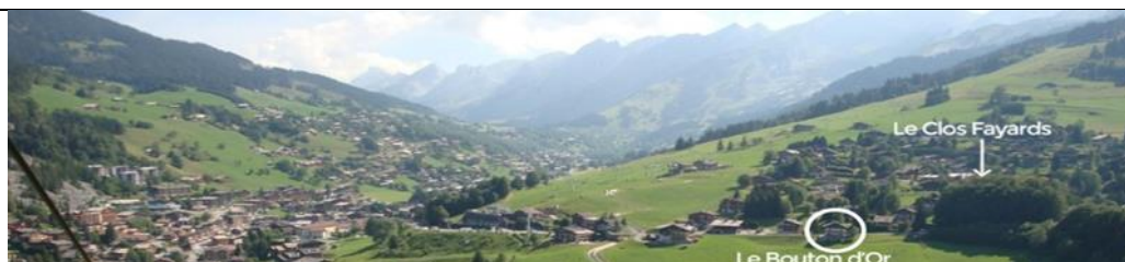
Vue du village et situation des chalets Le Bouton d'Or et Le Clos Fayards