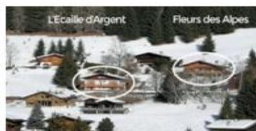
Les chalets sont à 50m l'un de l'autre