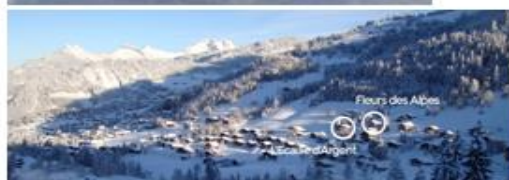
Vue de la vallée des Aravis et situation des chalets