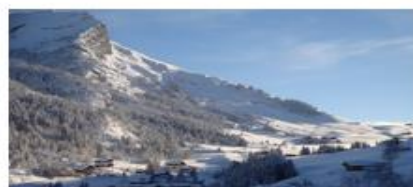
Vallée des Aravis via le Col des Aravis 1498 m