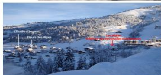
L'Ecaille d'Argent et Fleurs des Alpes