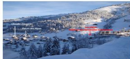
L'Ecaille d'Argent et Fleurs des Alpes