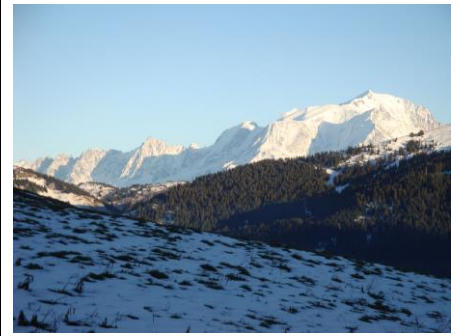
Vue sur la chaîne du Mont Blanc depuis le Col des ARAVIS 1500m.