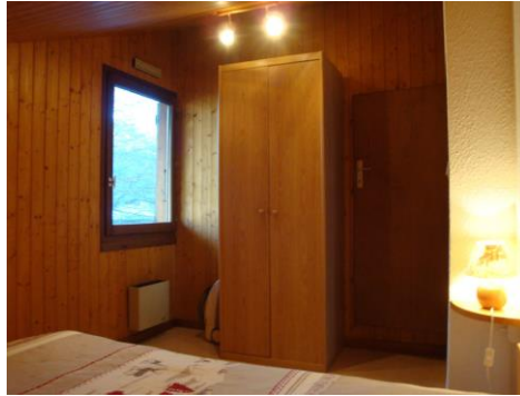
La chambre avec le lit de 1.60m.