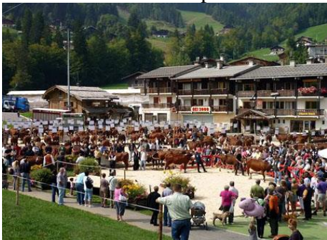
Foire de la Croix en septembre