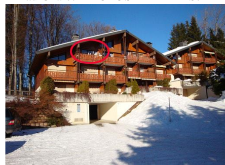
Le séjour exposé SUD.