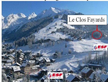
Le séjour exposé SUD.

Vue du village et du CLOS FAYARDS + RDV ESF Champ Giguet / Champ Bleu.