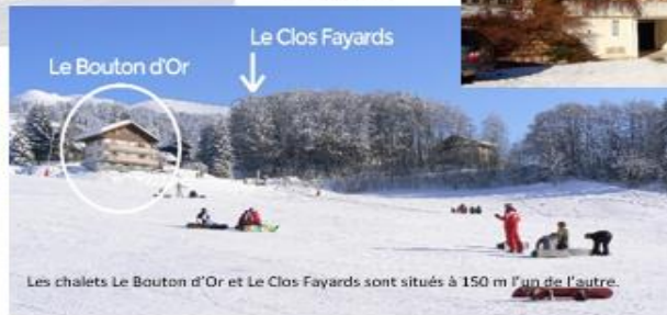
Les chalets Le Bouton d'Or et Le Clos Fayards sont situés à 150 m l'un de l'autre.