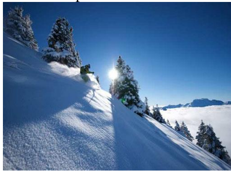
Le ski en poudreuse vous attend...