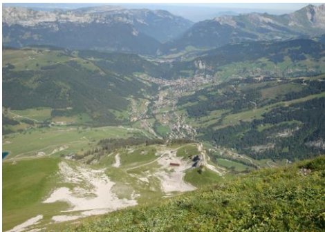
Vue sur la vallée des ARAVIS depuis le sommet du massif de l'Etale 2400m