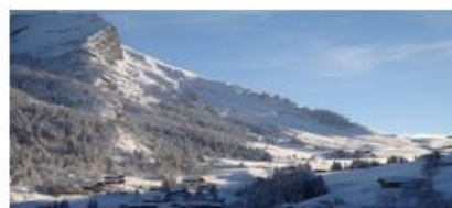
Vallée des Aravis via le Col des Aravis 1498 m