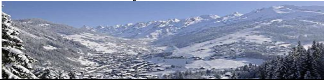
Vue du village et de la Chaîne des Aravis.