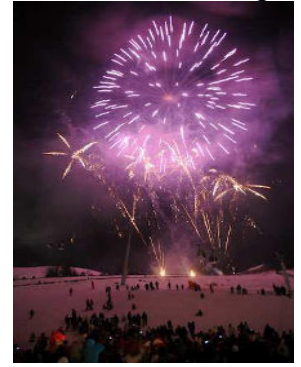
Feux d'artifices au Champ Giguet.