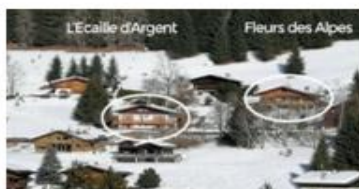
Les chalets sont à 50m l'un de l'autre