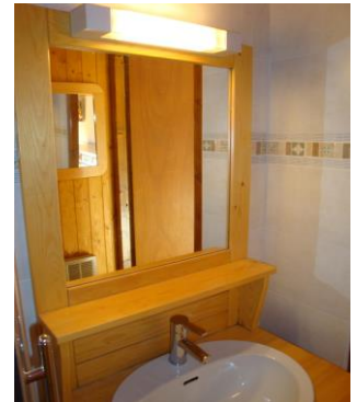
Salle de douche.