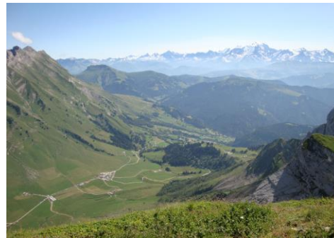
Vue sur la chaîne du Mont Blanc depuis le sommet du massif de l'Etale 2400m.